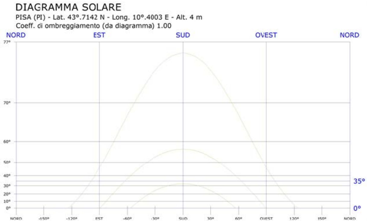
Fig. 2: Diagramma solare

Il Coefficiente di Ombreggiamento, funzione della morfologia del luogo, è pari a 1.00 . Di seguito il diagramma solare per il comune di PISA: